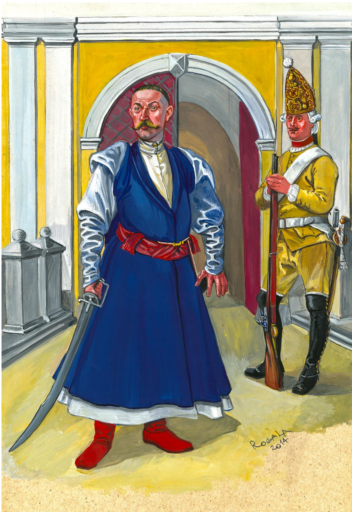
Шляхтич-клиент и рядовой гренадерской роты надворных войск К. Радзивилла, кон. 1760-х гг.