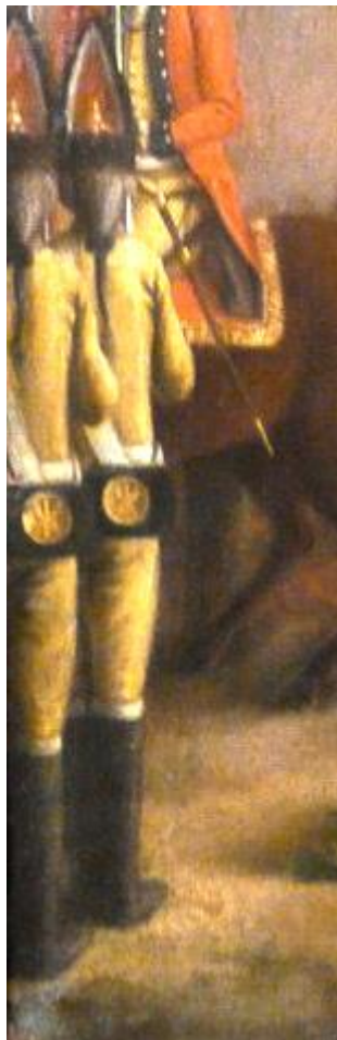
Гренадеры армии Речи Посполитой. Фрагмент картины «Станислав-Август Понятовский на военном параде». Худ. И. Пешка, кон. 1780-х гг.

на Родину князь все-таки смог вернуть себе многие из них, в том числе и должность виленского воеводы. Тем не менее, 1764 год остался в его памяти как наиболее трудный год жизни. Кто знает, быть может, сабля из собрания Национального исторического музея Беларуси также пережила эти события вместе с князем.