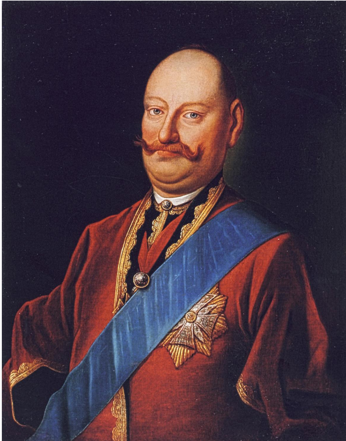
Кароль Станислав Радзивилл - «Panie Kochanku». Неизвестный художник XVIII века.

брату великого гетмана литовского, с заверением о полной поддержке в случае конфликта с Радзивиллами.